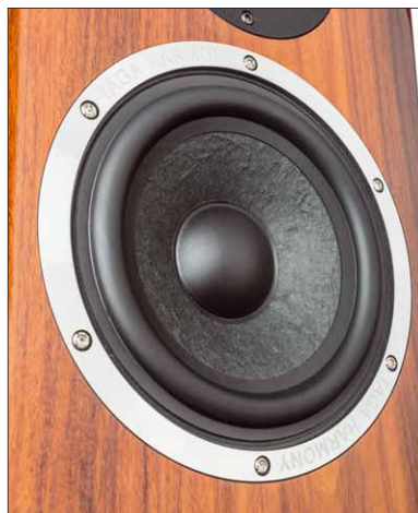
Die leichte Papiermembran des Taga-Lautsprechers sitzt in einem gut belüfteten Korb mit starkem Antrieb